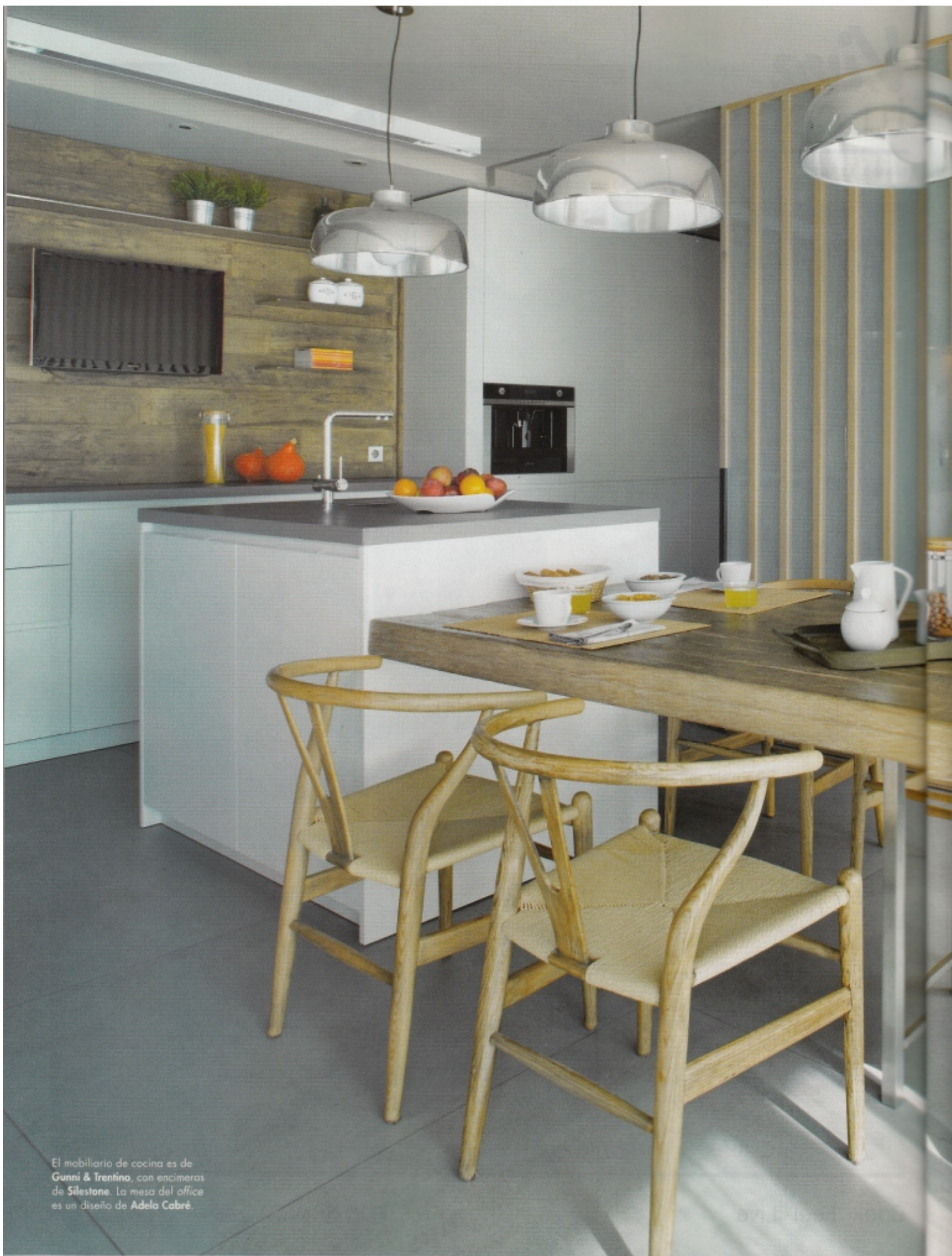
El mobiliario de cocina es de Gunni & Trentino , con encimeras de Silestone . La mesa del office es un diseño de Adela Cabré .