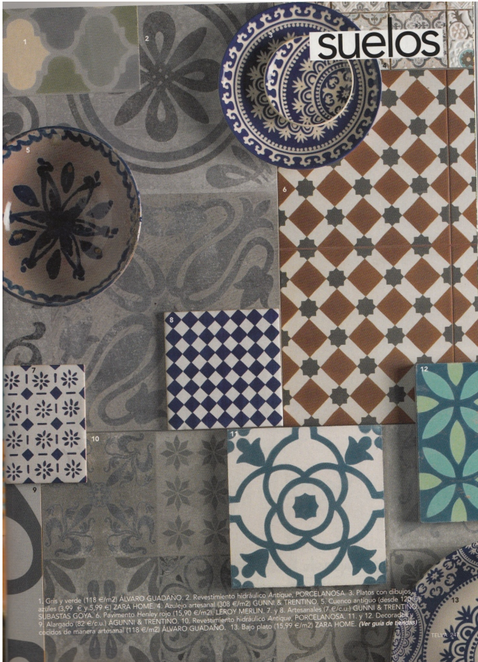
1. Gris y verde (118 €/m 2 ) ÁLVARO GUADAÑO. 2. Revestimiento hidráulico Antique, PORCELANOSA. 3. Platos con dibujos azules (3,99 € y 5,99 €) ZARA HOME. 4. Azulejo artesanal (308 €/m 2 ) GUNNI & TRENTINO. 5. Cuenco antiguo (desde 120 €) SUBASTAS GOYA. 6. Pavimento Henley rojo (15,90 €/m 2 ), LEROY MERLIN. 7. y 8. Artesanales (7 €/c.u.) GUNNI & TRENTINO. 9. Alargado (82 €/c.u.) ÁGUNNI & TRENTINO. 10. Revestimiento hidráulico Antique, PORCELANOSA. 11. y 12. Decorados y cocidos de manera artesanal (118 €/m 2 ) ÁLVARO GUADAÑO. 13. Bajo plato (15,99 €/m 2 ) ZARA HOME. (Ver guía de tiendas)