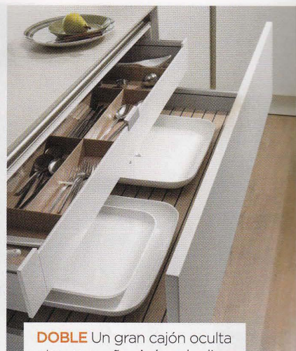
DOBLE Un gran cajón oculta otro pequeño. Así se duplica la capacidad y se ofrece una imagen limpia. De SieMatic.