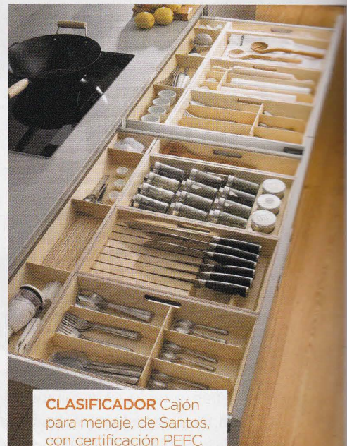
CLASIFICADOR Cajón para menaje, de Santos, con certificación PEFC