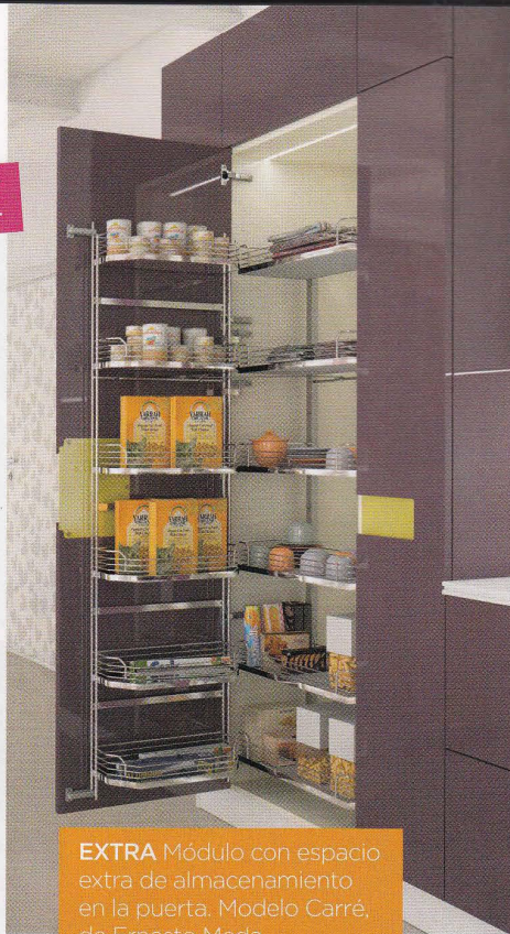
EXTRA Módulo con espacio extra de almacenamiento en la puerta. Modelo Carré, de Ernesto Meda.