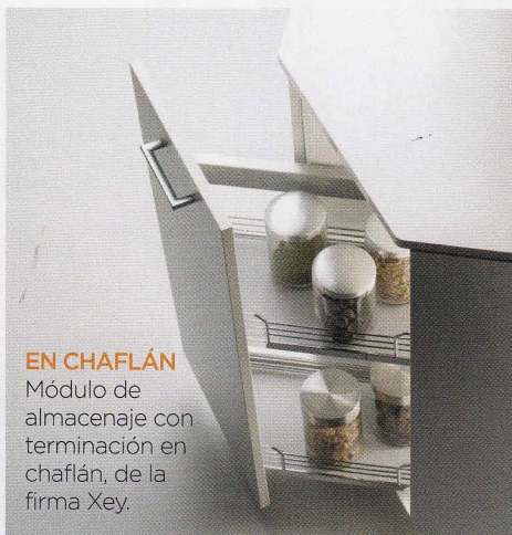
EN CHAFLÁN Módulo de almacenaje con terminación en chaflán, de la firma Xey.