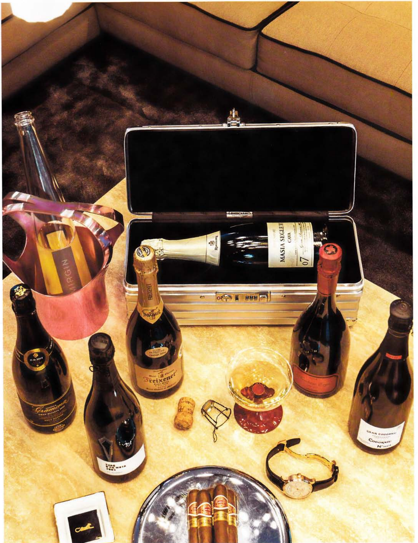
Ecológico, MIRGIN BRUT NATURE GRAN RESERVA 2010 (30 €). Con personalidad, MASIA SEGLE XV GRAN RESERVA BRUT NATURE 2007 (17 €). Artesanal, ENOTECA GRAMONA GRAN RESERVA BRUT NATURE 2001 (129 €). De xarel·lo, TURÓ D'EN MORA BRUT NATURE 2003 (98 €). Artesanal, FREIXENET CUVÉE PRESTIGE CASA SALA BRUT NATURE 2006 (29 €). Pinot noir, rosado, TANTUM ERGO BRUT NATURE 2013 (21 €). Edición limitada, GRAN CODORNIU FINCA LA PLETA 2009 (13 €). Maleta, RIMOWA (320 €). Conició, CARTIER (c.p.v.). Copa, ARMANI HOME (c.p.v.). Reloj, IWC . Habanos, ROMEO Y JULIETA (12,8 €). Mobiliario en GUNNI&TRENTINO .