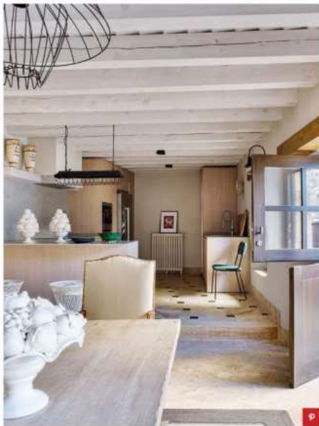
El mobiliario de cocina, de roble con encimera porcelánica en acabado cemento, procede de Gunni & Trentino . La silla verde y las piezas de cerámica son de Rue Vintage 74.