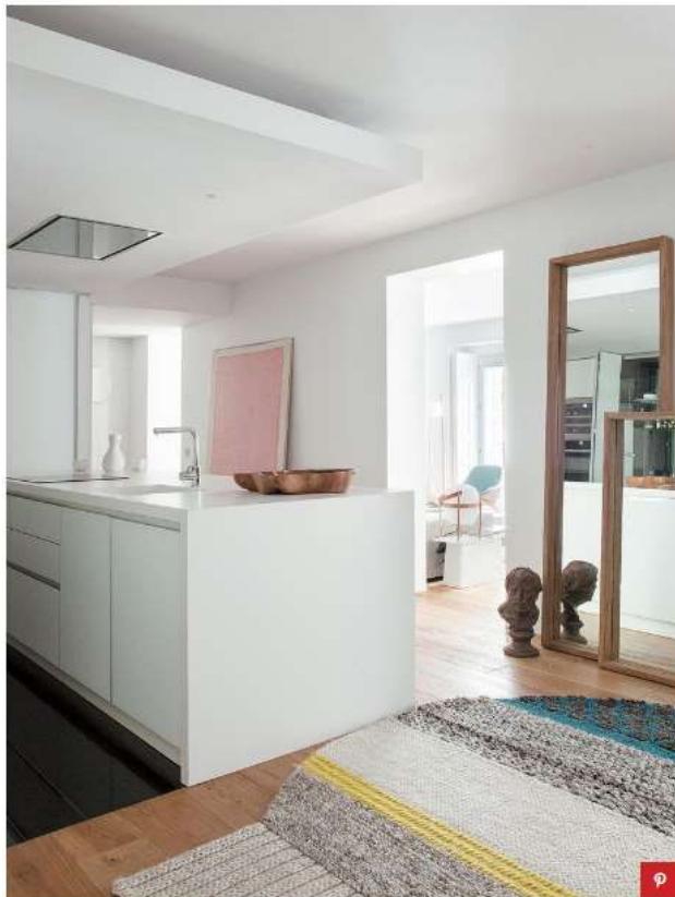
En el área de recibidor, los dos espejos superpuestos y la alfombra de Gan, todo en Batavia, suman su calidez a la de la tarima de roble de la firma Anticato. El busto en bronce es obra de Jerónimo Hernández.