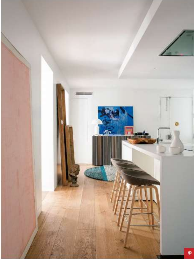
En la isla central incorpora una zona de trabajo y una barra de desayunos con taburetes de Batavia. Montse Garriga