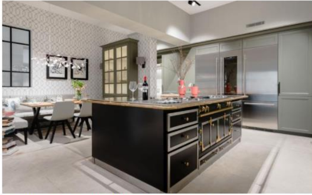
Vista de una de las cocinas de Gunni Trentino, en la que se integra un comedor.

«Estoy montando la nueva cocina de mi casa de Morata de Tajuña , en el campo, y me encanta recorrer esta tienda, que tiene de todo. Son expertos en interiorismo, diseño y decoración . Me gustan sus muebles, tan funcionales y llenos de detalles. Estoy entusiasmada con este proyecto». ( gunnitrentino.es ).